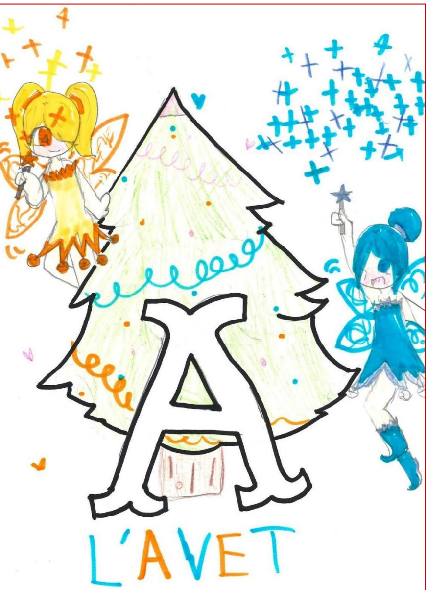
Dibuixat per Shangran Yang i pè de pè